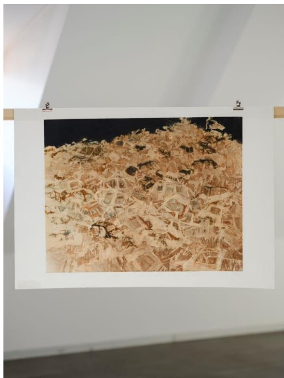
Foto popiska: Tatsiana Byts – Nejčastěji se do šrotu řadí samoty pro následné zpracování nebo likvidaci, akvatinta, 990 x 692 mm, 2023. prostory Staroměstské radnice.