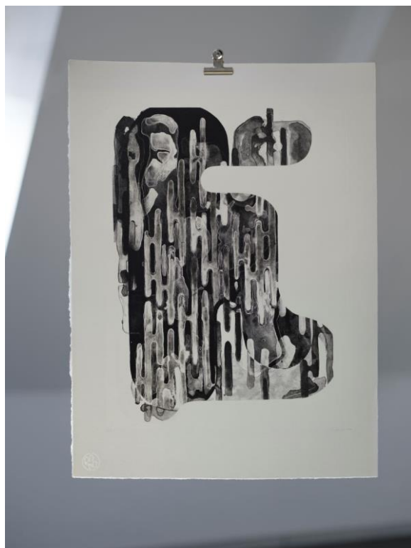
Foto popiska: Lúbia Vandlíková – Anartha, litografie, 720 x 530 mm, 2023. Foto: Saša Dobrovodský, prostory Staroměstské radnice.