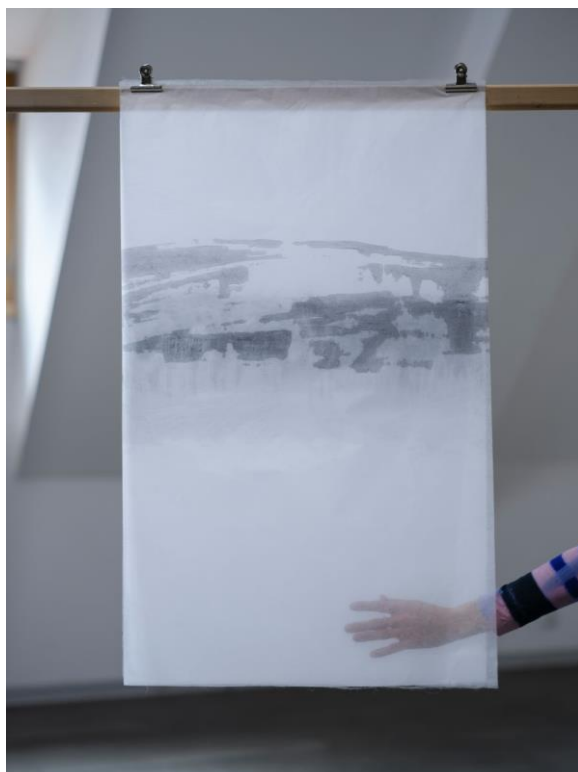
Foto popiska: Eva Vápenková – Moje skutečnost, karborundový tisk, 980 x 620 mm, 2023. Foto: Saša Dobrovodský, prostory Staroměstské radnice.