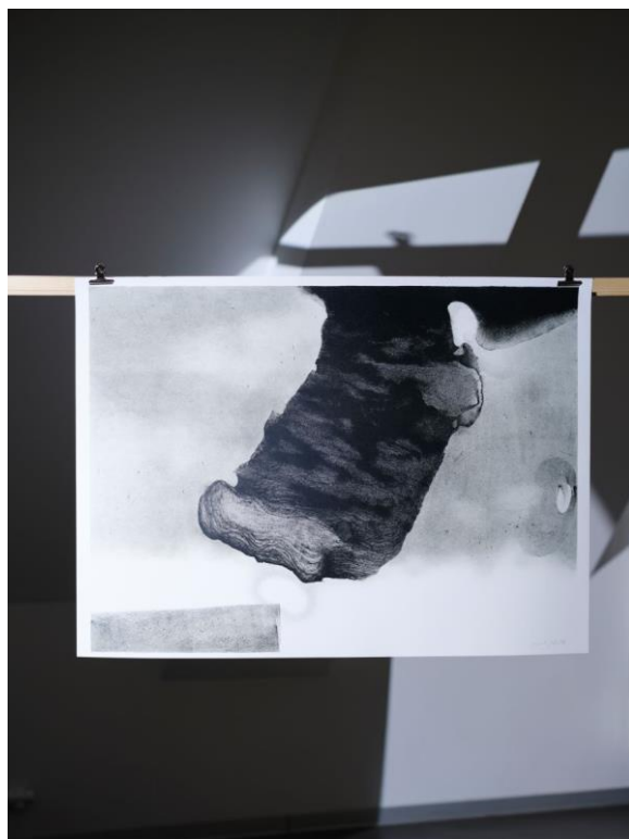
Foto popiska: Miroslav Pošvic – Snesitelná tíha bytí, litografie, 840 x 1140 mm, 2023. Foto: Saša Dobrovodský, prostory Staroměstské radnice.