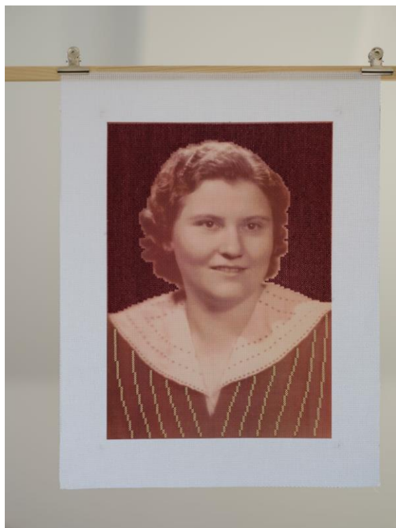
Foto popiska: Sofie Eliášová – 1929, počítačová grafika, 394 x 518 mm, 2023. prostory Staroměstské radnice.