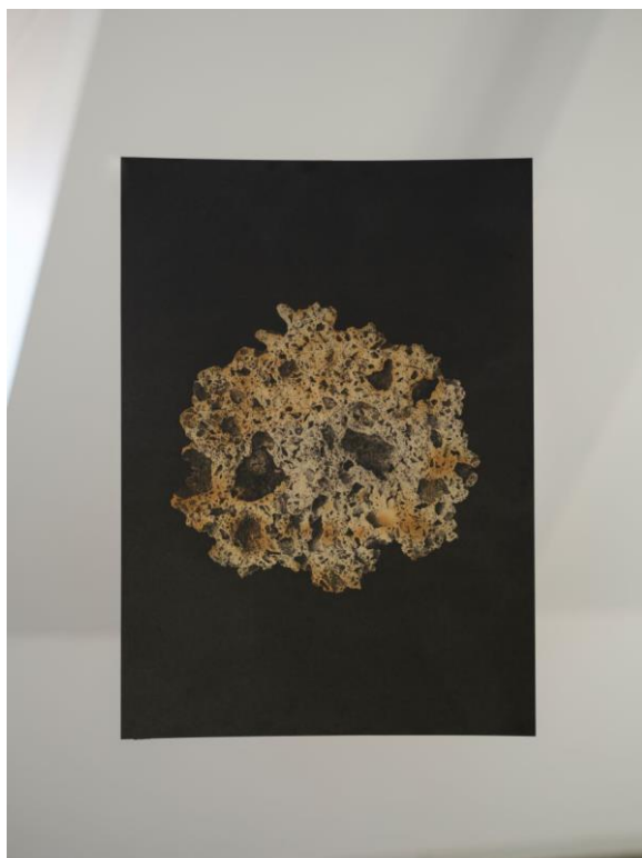
Foto popiska: Adriana Tomulcová – Puto k pôde, serigrafie, vytírání barvy, 500 x 700 mm, 2023. Foto: Saša Dobrovodský, prostory Staroměstské radnice.