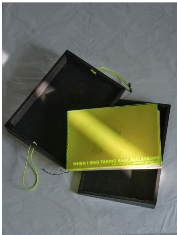
Foto popiska: Šimon Brejcha – Jak jsem se učil anglicky, inkoustový tisk, šablony, 70 x 250 x 360 mm, 2023. prostory Staroměstské radnice.