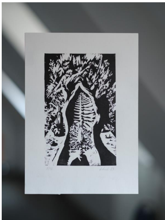
Foto popiska: Šimon Fibrich – Zabijačka, linoryt, 350 x 250 mm, 2023. Foto: Saša Dobrovodský, prostory Staroměstské radnice.