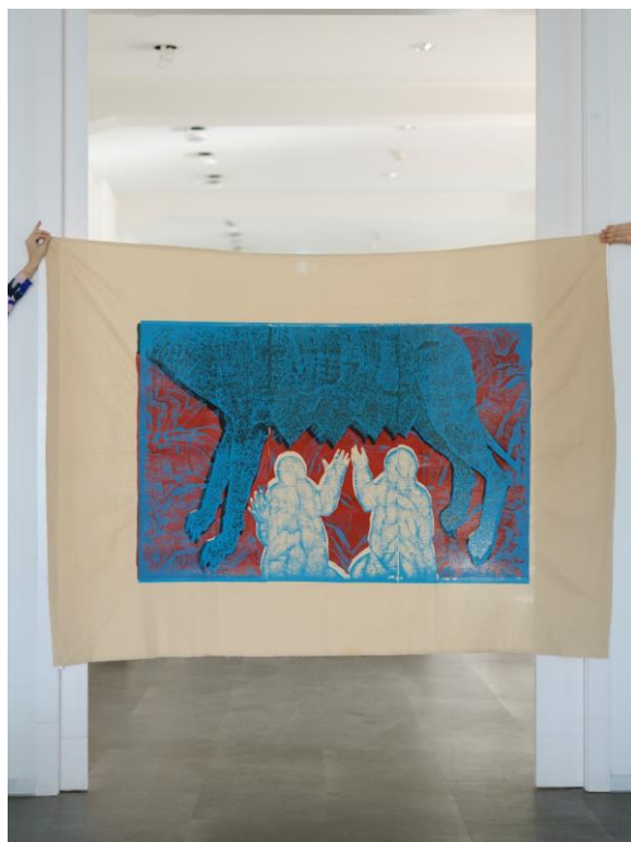
Foto popiska: Vojtěch Hrubant – Kapitolská vlčice, sítotisk, 2000 x 1500 mm, 2023. prostory Staroměstské radnice.