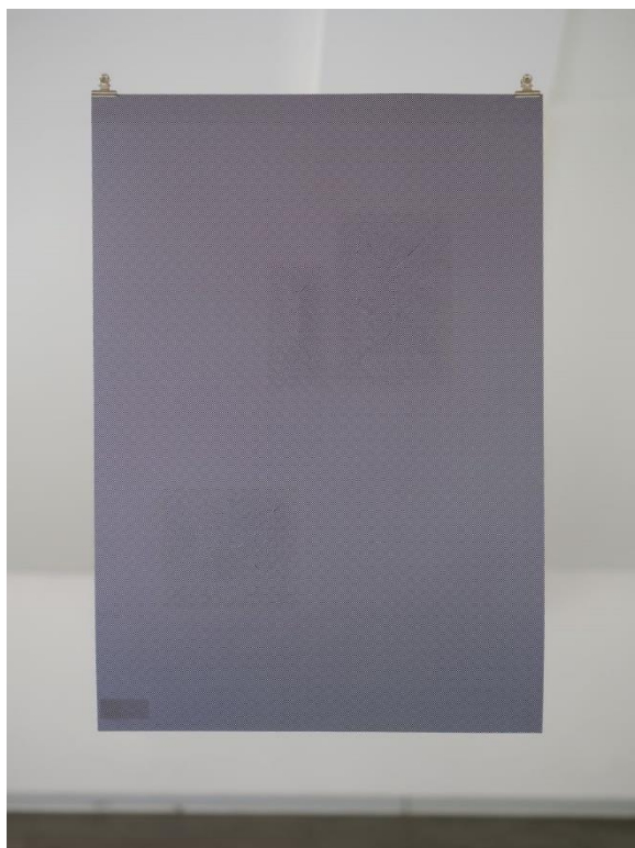
Foto popiska: Olga Moravcová – z cyklu Komunikace, počítačová grafika, 1000 x 707 mm, 2023. prostory Staroměstské radnice.