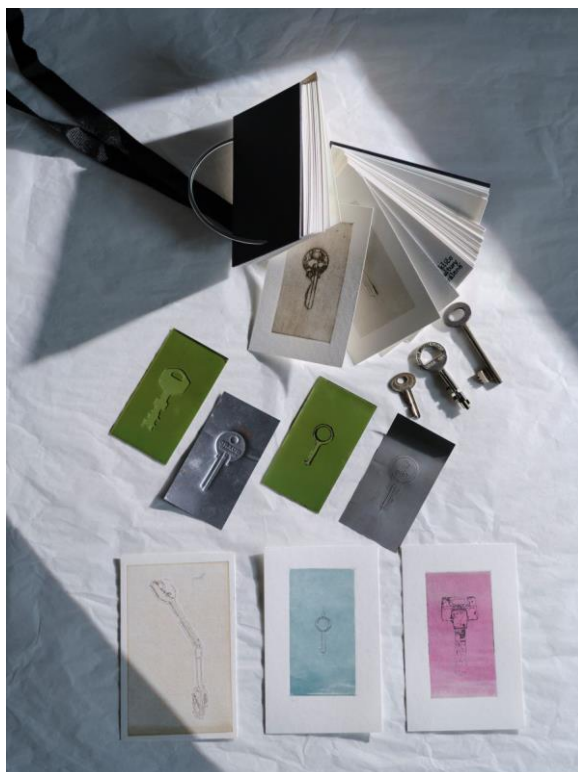
Foto popiska: Damián Tejkl – Klíče (matrice, 3 grafické karty), kombinovaná technika, 2023. Foto: Saša Dobrovodský, prostory Staroměstské radnice.