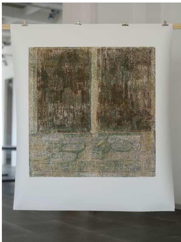
Foto popiska: Markéta Bábková – Dřevěné okno, dřevoryt, 1520 x 1320 mm, 2023. Foto: Saša Dobrovodský, Staroměstské radnice.